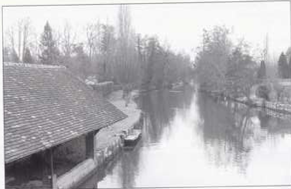
L'Eure à Saint-Piat. Centre.

Le débit de 46 m 3 /s correspondant à la crue de 1995 et d'une période de retour de 10 ans a été retenu pour la