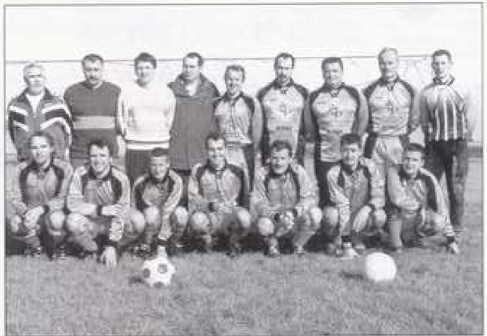
Saint-Piat, UFOLEP, saison 2001/2002.