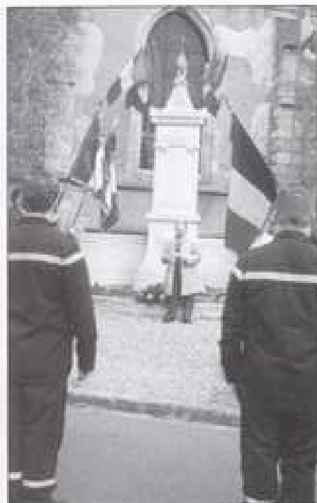
Allocution du Président.