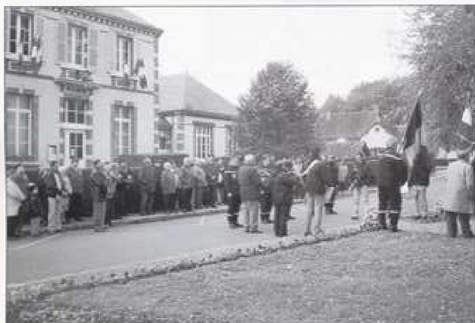
Minute de silence au monument aux morts.