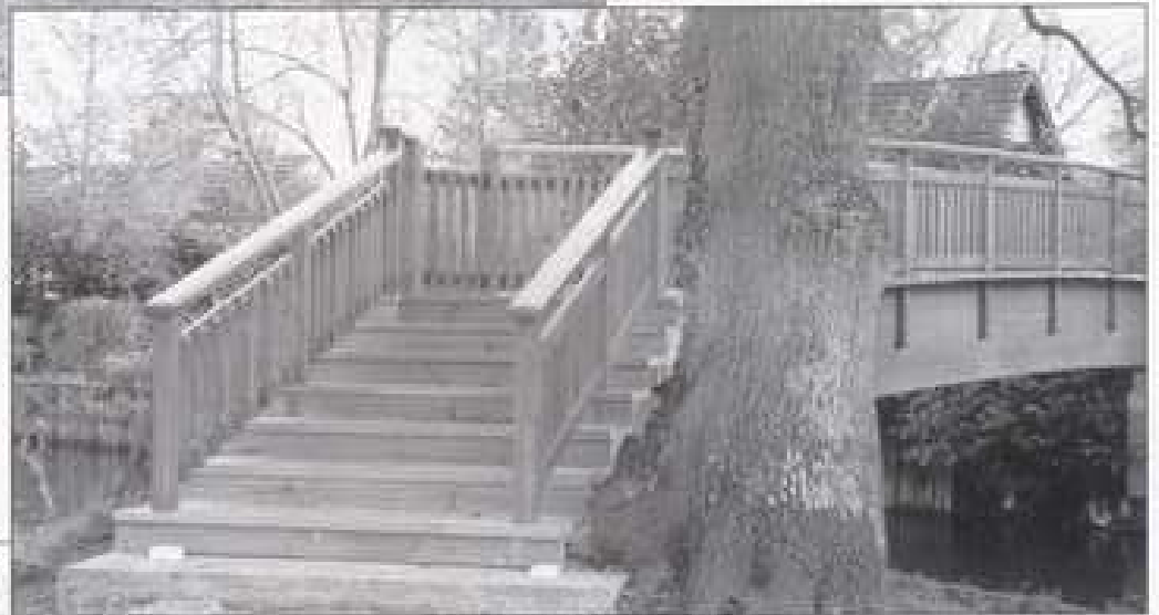
Passerelle côté rue des Martels.