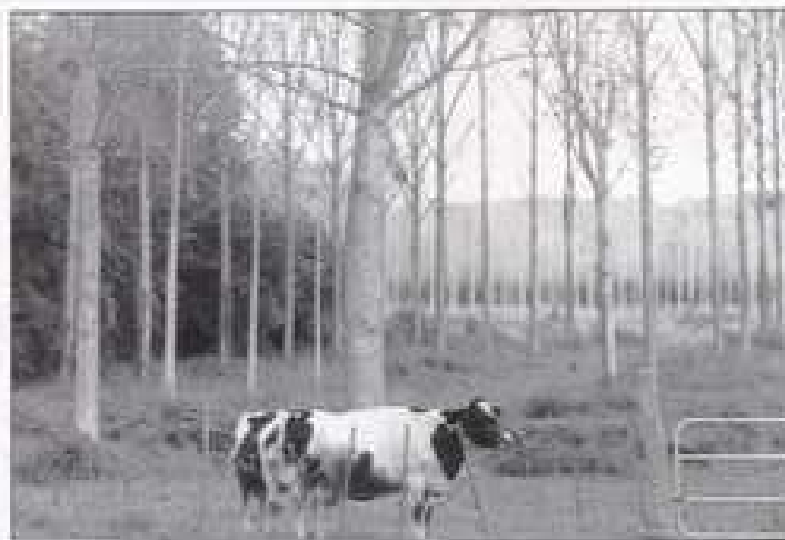
Les dernières vaches de la prairie de Grogneul et de Saint-Piat.