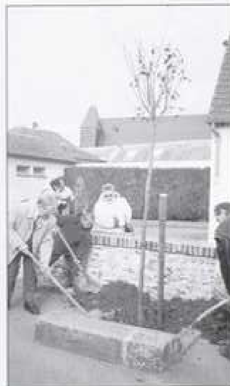
Plantation d'un arbre du souvenir.