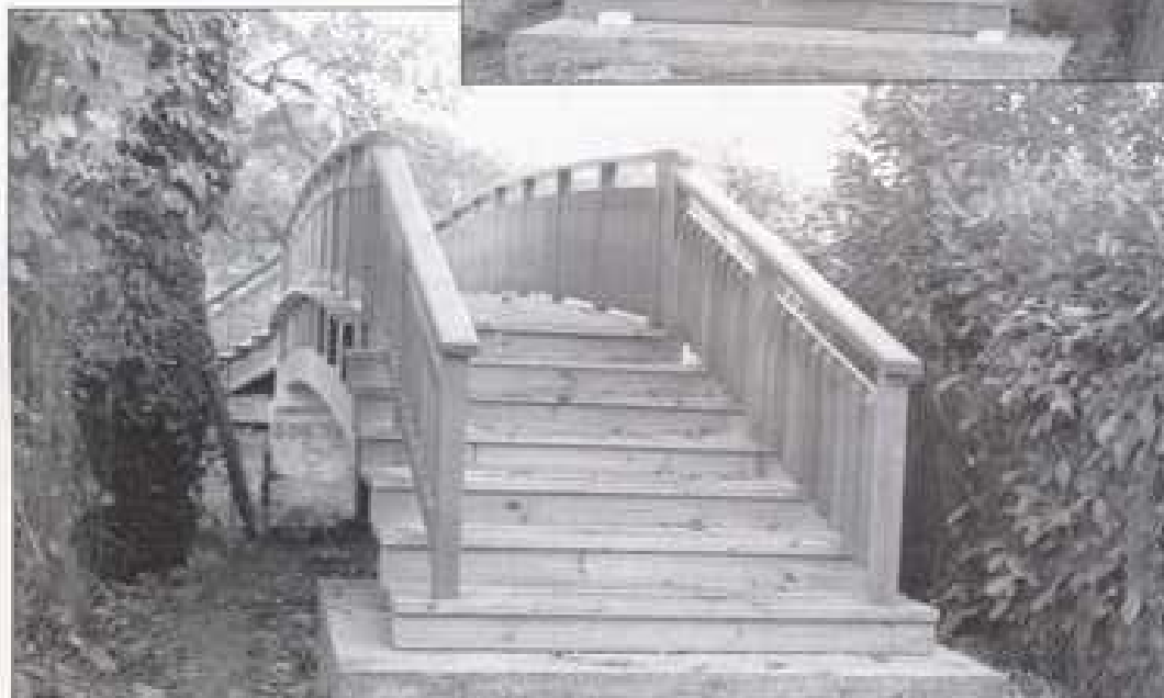
Passerelle côté rue R. Poisson.