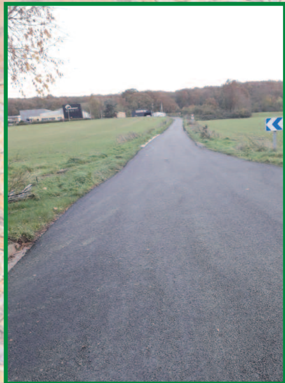
rue de Jouvence