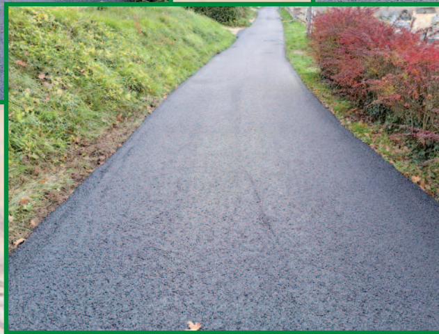
Impasse des Vignes