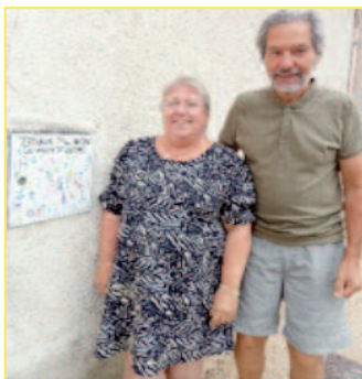
Concours boîtes à lettres