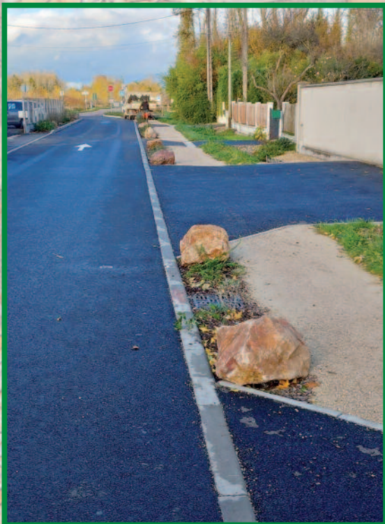
rue du Luxembourg