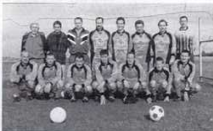
L'équipe sénior UFOLEP 2001. Maillots offerts par les Ets A.C.P.