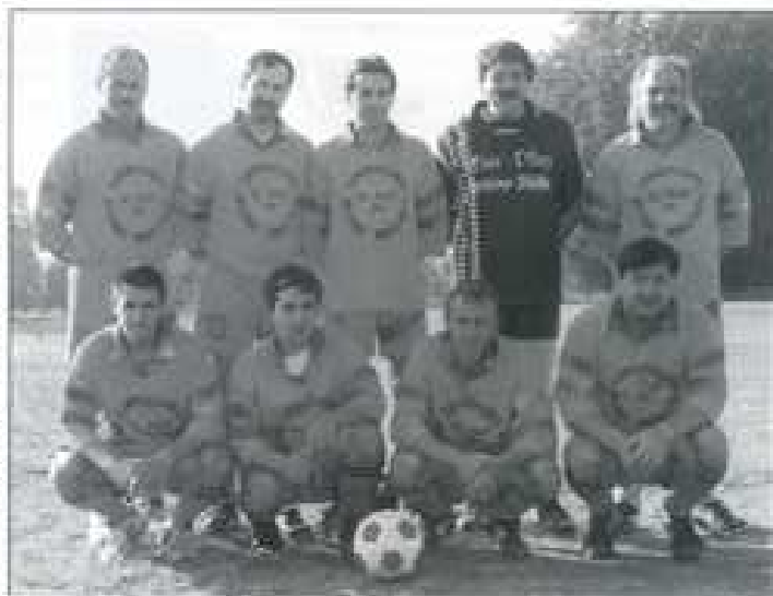
Une des deux équipes UFOLEP qui évoluent le dimanche matin.