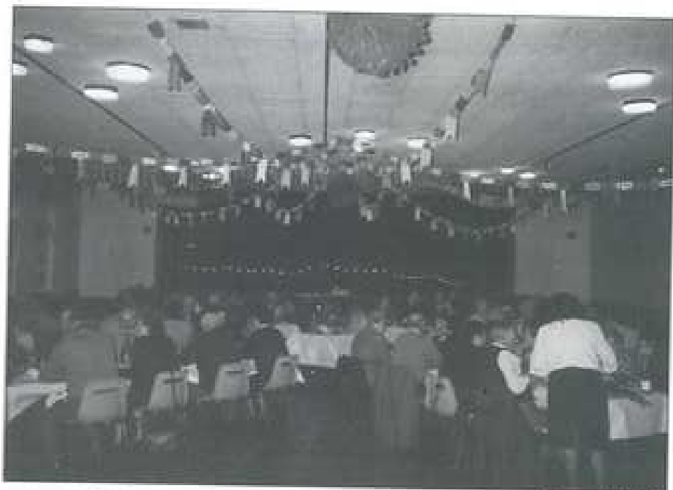
Repas de Noël

Notre déjeuner s'est déroulé dans une excellente ambiance à la satisfaction des 49 participants. Quelques amis souffrants manquaient malheureusement. La salle bien décorée et la qualité du repas servi avec gentillesse par notre