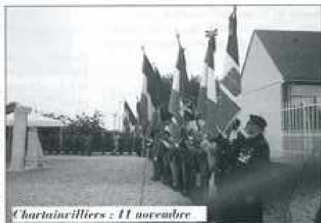
Chartainvilliers : 11 novembre

Et si votre assurance garantissait vraiment votre tranquillité ?