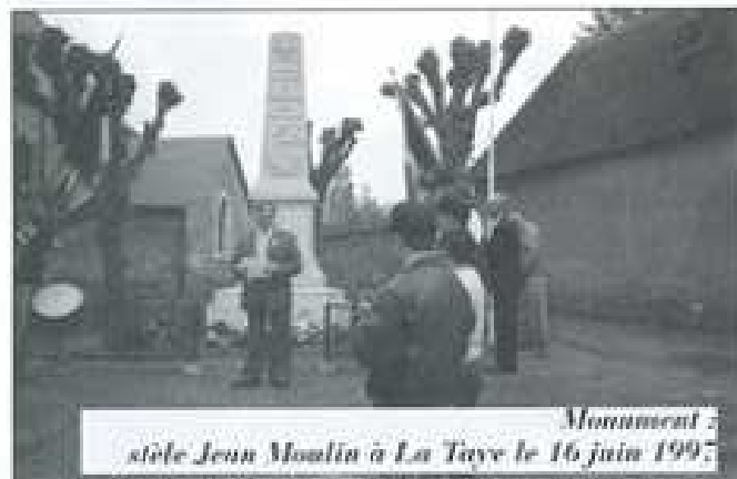
Monument à sûte Jean Moulin à La Tave le 16 juin 1997