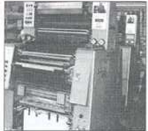
Machine offset 4 couleurs.

Clientèle : Administrations, ministères, banques, assurances, travaux publics, transports terrestres et aériens, télévis-