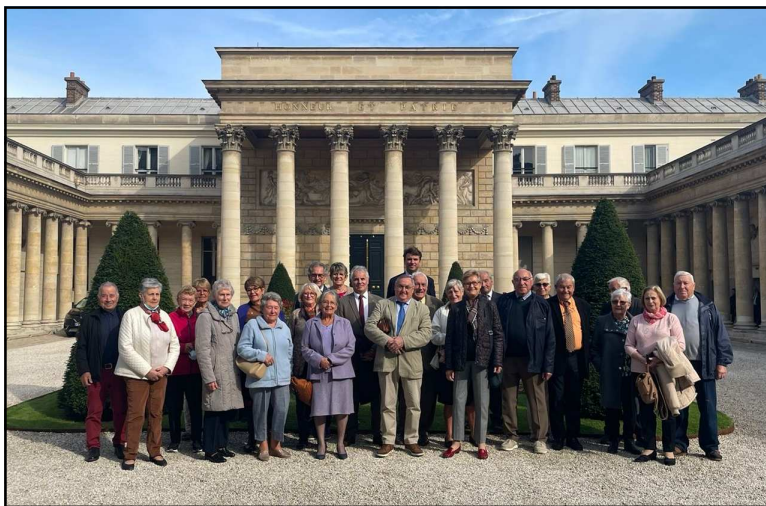
Le groupe en visite au musée de la Légion d'honneur

Accueillis le matin par M. le Grand Chancelier pour une visite spéciale, nous avons pu découvrir, commentées par la Conservatrice du musée, les superbes collections nationales et internationales de médailles, décorations et objets anciens.