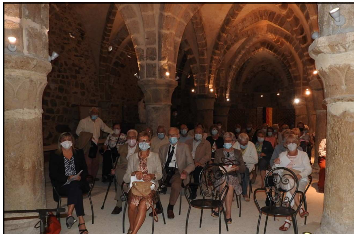
L'assistance lors de l'Assemblée générale